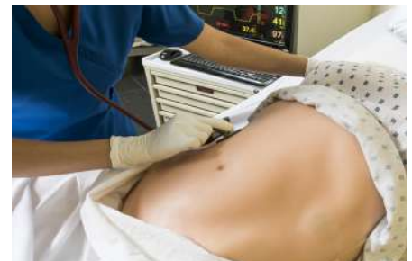
Ruidos de colon programables