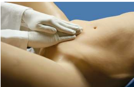
Cubierta abdominal no embarazada palpable