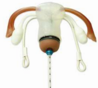
Útero transparente para colocación y evaluación del DIU